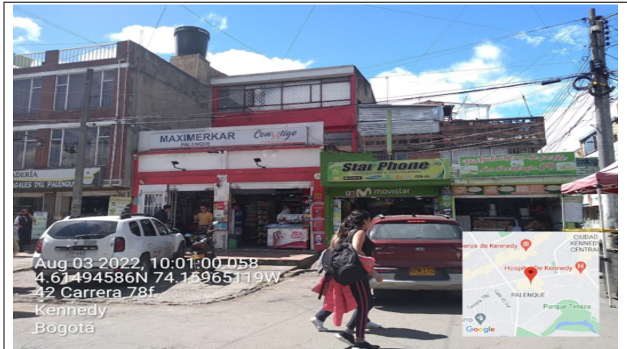
Vista panorámica del predio en el que se sitúa el establecimiento comercial denominado STAR PHONE 78 ubicado en la CR 78 F No. 42 – 22 SUR LC 101